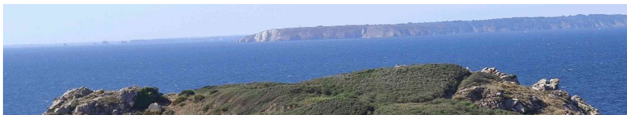
Le calme avant la tempête