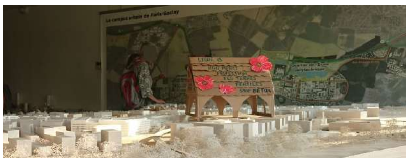
Concertation à l'EPAPS, lundi 12 juin 2023. Une grangette...

A Cergy le 8 juillet à 14h : l'association Cergy Pontoise Environnement organise une manifestation contre la privatisation d'une partie de la base de loisirs régionale de Cergy au profit de l'installation d'une aire de paintball. Plus d'informations sur https://cergy-pontoise-environnement.fr