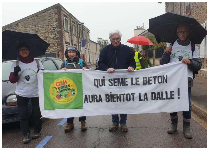
Délégation du CPTG à la manifestation contre le projet de l'A104 Bis

✕ Le 12 novembre, une délégation du CPTG a participé à la manifestation contre la A 104 Bis du Pont d'Achères à la Mairie de Carrières-sous-Poissy pour protester contre un projet de 2 x 2 voies de 7 kilomètres qui permettrait de relier l'A13 et l'A15, menaçant ainsi de détruire 30 hectares d'espaces naturels, à ce jour préservés des voitures.