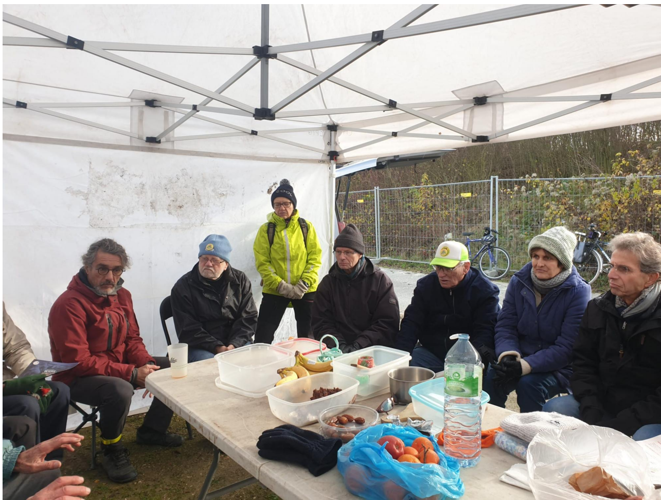
Une vingtaine de militant·es a participé à la dernière ZADimanche du 26 novembre, par une belle journée hivernale !