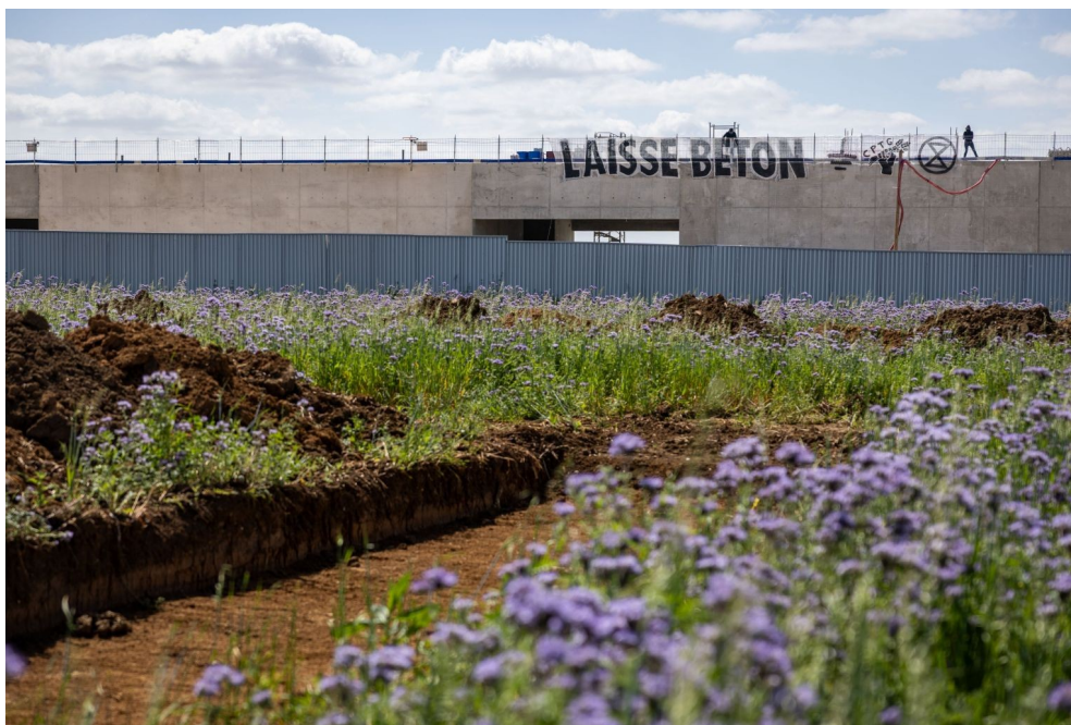
Intrusion des Soulèvements de la terre IDF, Extinction Rebellion IDF et du Collectif Pour les Terres de Gonesse sur la gare de Gonesse en construction le 5 mai 2025.

Ce dimanche à midi, un petit groupe de militant.e.s s'est introduit dans le désormais barricadé chantier de la gare de Gonesse, et a escaladé le bâtiment en construction pour y déployer une banderole géante portant ces deux mots : "Laisse béton", accompagnés des logos d'Extinction Rebellion, des Soulèvements de la Terre et du Collectif pour les Terres de Gonesse. Par cette action coup de poing, les 3 organisations entendent dénoncer l'hypocrisie des élu-es en matière de souveraineté alimentaire et de dépense d'argent public, et empêcher la bétonisation des terres qui comptent parmi les plus fertiles de France. Une action qui acte le début d'une série au sein des "Soulèvements de la Seine".