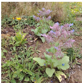
Bourraches utiles au potager - Triangle été 2025