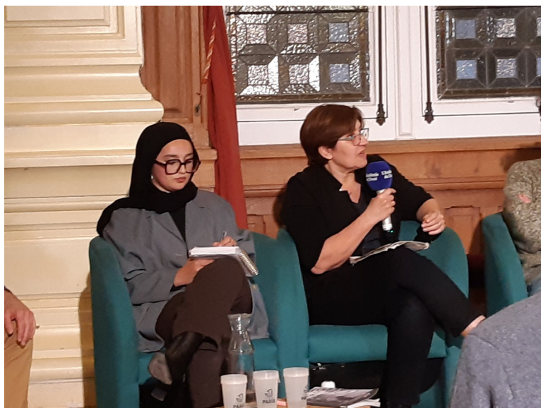
Photo des intervenantes